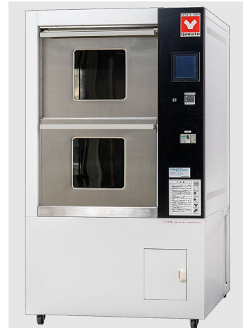
Машины посудомоечные лабораторные