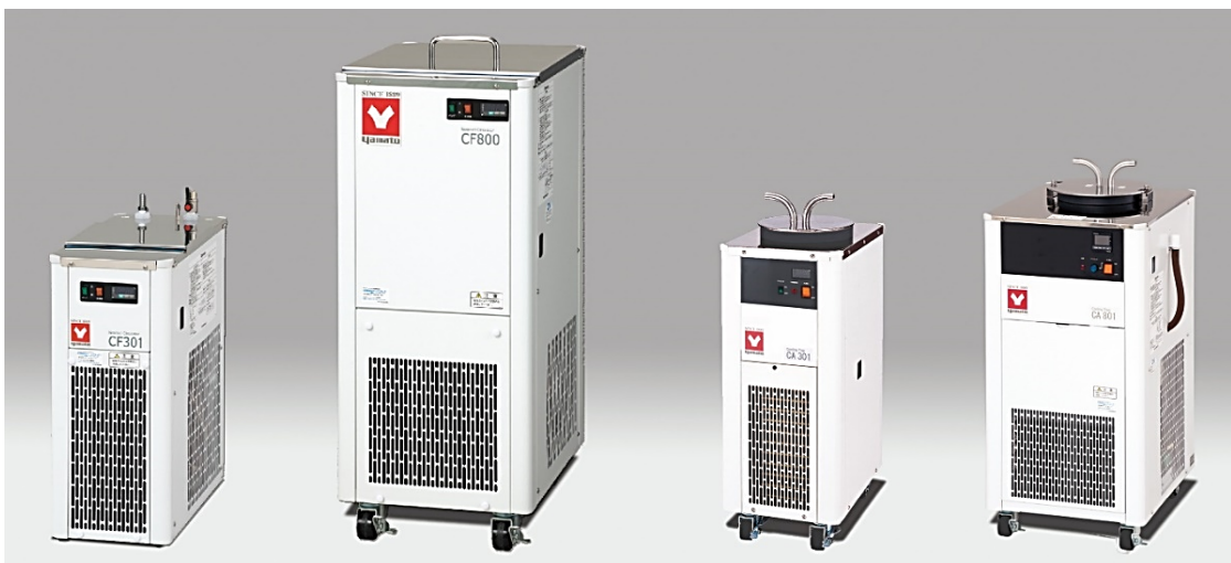
CF/CA - чиллеры/ охладители и циркуляторы лабораторные