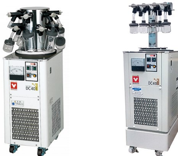
DC - лиофильные (сублимационные) сушилки