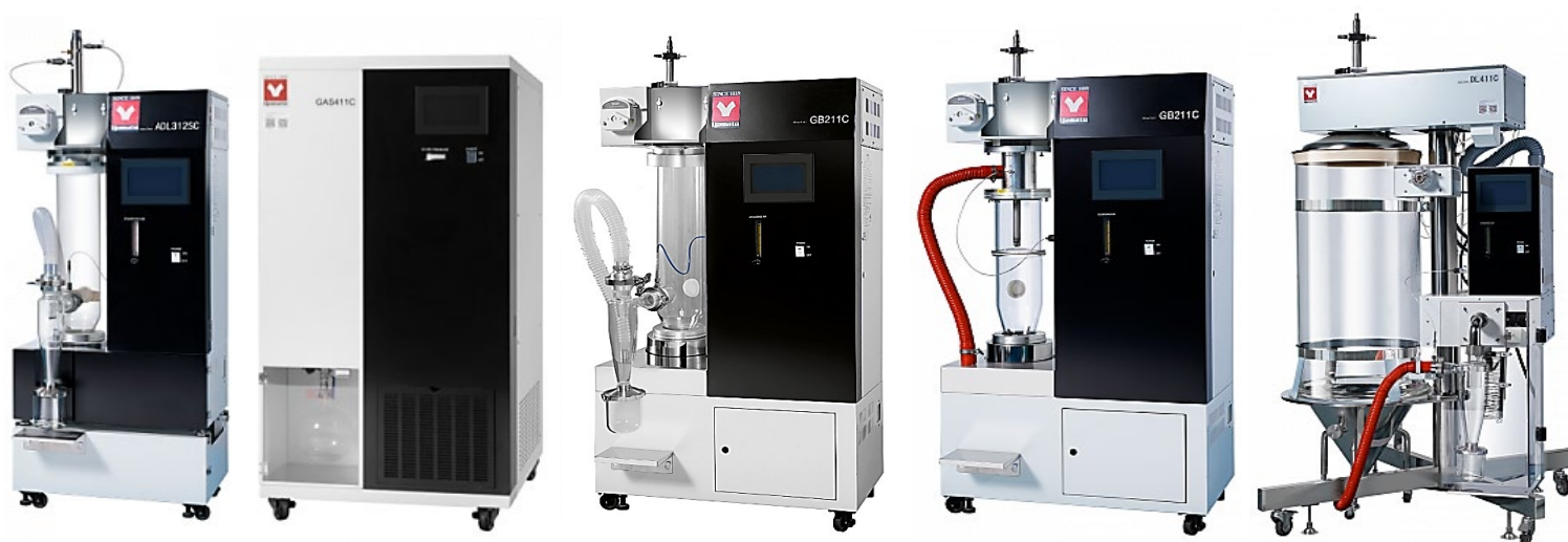
GB / ADL / DL - распылительные сушилки