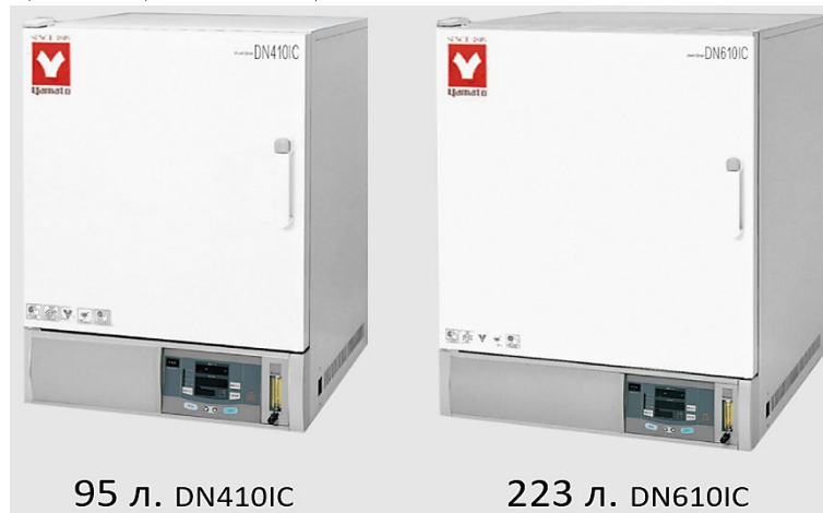
95 л. DN410IC