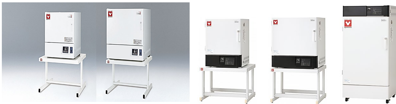
SI / SK - стерилизаторы лабораторные суховоздушные