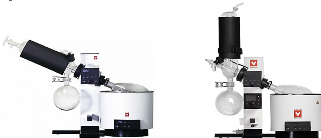
RE - цифровые и программируемые ротационные испарители с моторизированным подъемником