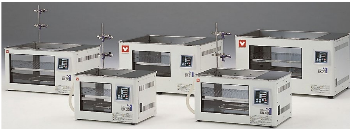
Водяные и масляные бани